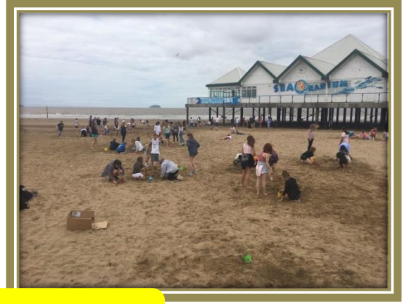
A day trip to the seaside.