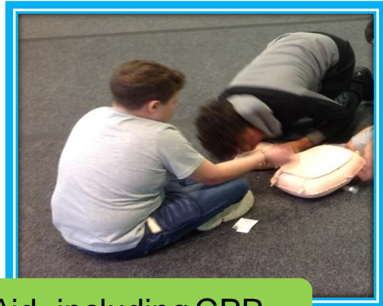
Learning First Aid, including CPR.