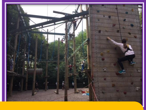
A day participating in outdoor and adventurous activities at Baggeridge Park.