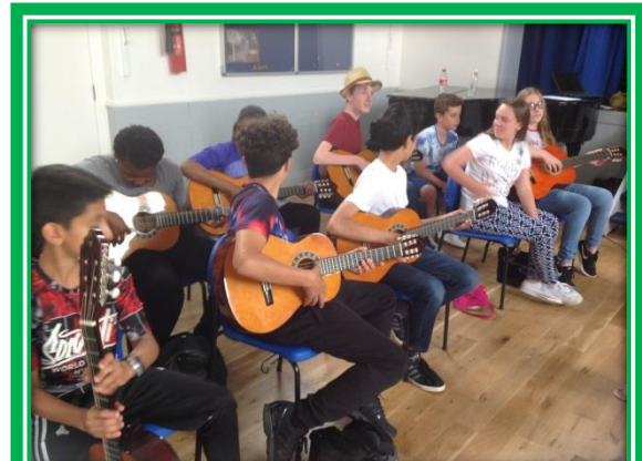
An opportunity to learn to play a musical instrument.